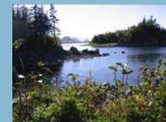
Vue sur le parc du Bic